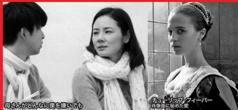
母さんがどんなに僕を嫌いでも